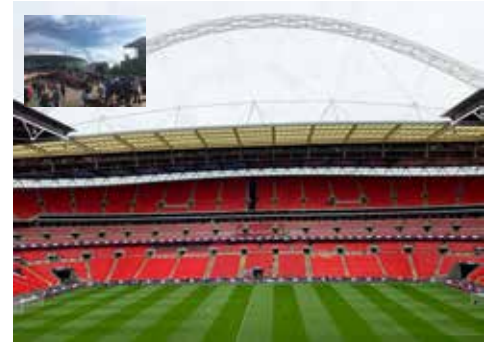
Vy från Centre Circle block 226