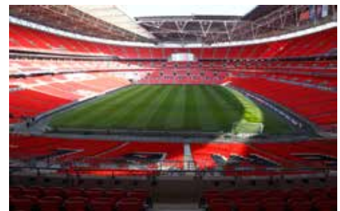
Vy från Inner Circle block 239