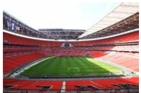
Vy från Inner Circle block 214