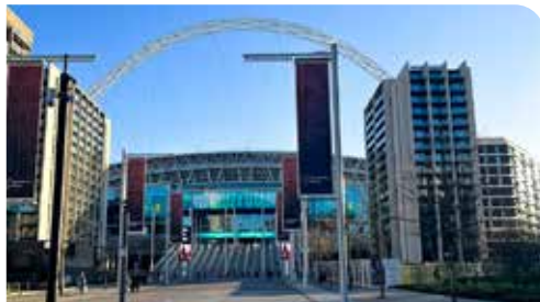
ENTRÉ Inner Circle och Centre Circle

Vid konserter varierar platserna från gång till gång, men platserna hittas alltid på Level 2. (Platser som börjar på 200)